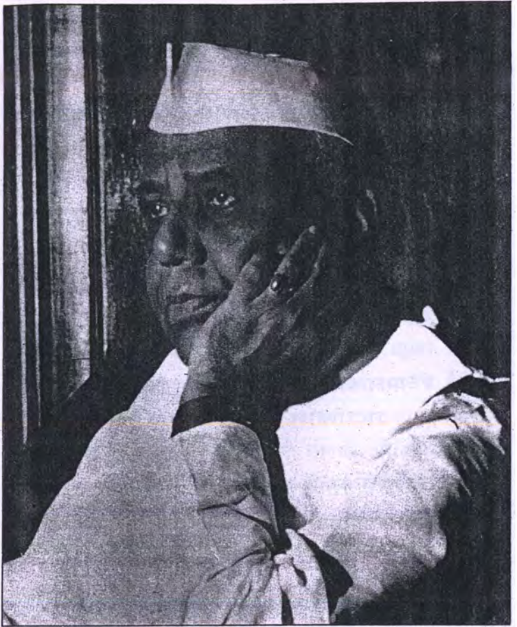
मा. यशवंतराव चव्हाण