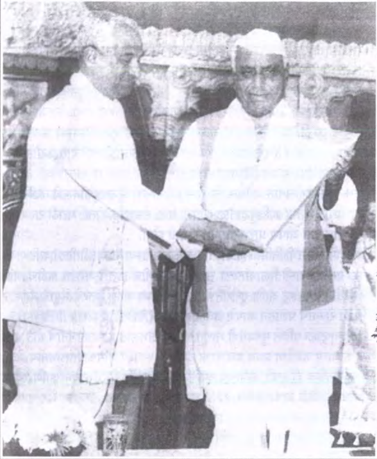
महाराष्ट्राचे राज्यपाल एअर मार्शल लतिफ यांचे हस्ते पुणे विद्यापीठाची डी.लिट् पदवी स्वीकारताना